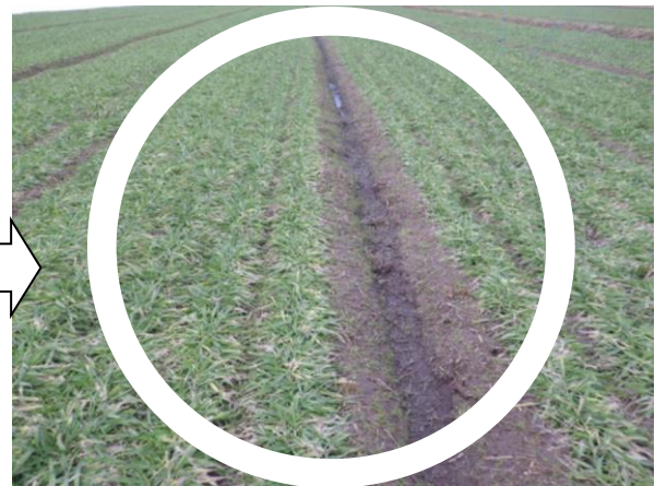
<停滞水なしほ場 3月6日>